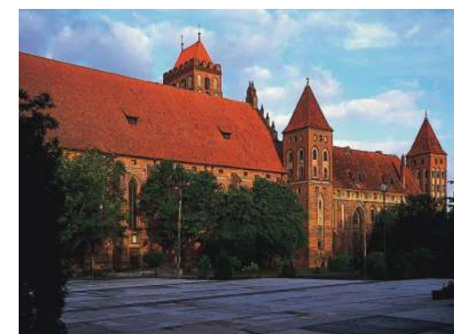
Katedra i zamek kapituły, widok od wschodu

jest dobrze zachowany, choć z pierwotnego czworoboku nie przetrwały dwa skrzydła. Zanim jednak przybyli tu Krzyżacy, obszar na prawym brzegu Wisły zamieszkały był w przeważającej części przez pruskie plemię Pomezanów. Z racji położenia geograficznego, ważności szlaku wiślanego w komunikacji i handlu, od zawsze ścierały się tu wpływy pomorsko-prusko-polskie.