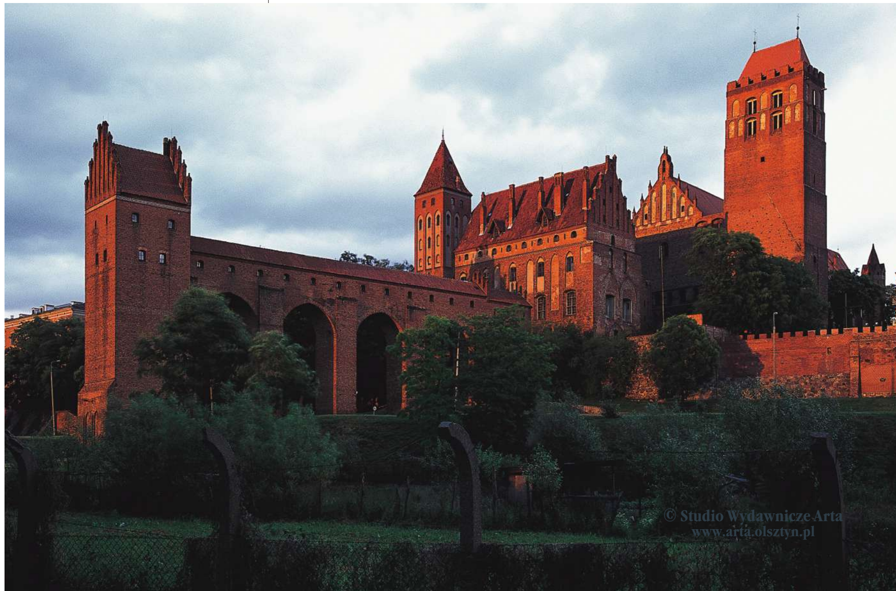
Widok na zamek i katedrę od zachodu; poniżej kapitel z niezachowanego skrzydła południowo-zachodniego

Kanonicy mieszkali na zamku do czasów reformacji, administrowali podległym im obszarem, a przede wszystkim opiekowali się katedrą, którą ozdabiano pięknymi polichromiami, ołtarzami i wzbogacano przez stulecia dziełami sztuki sakralnej. 14 marca 1440 roku w Kwidzynie odbył się zjazd założycielski przedstawicieli miast Związku Pruskiego, którego wynikiem była deklaracja o oddaniu Prus pod opiekę królowi polskiemu i wybuch wojny trzynastoletniej (1454–1466). Miasto i zamek były podczas niej oblegane. Na mocy II pokoju toruńskiego Kwidzyn pozostał w ramach państwa krzyżackiego, ale na biskupa