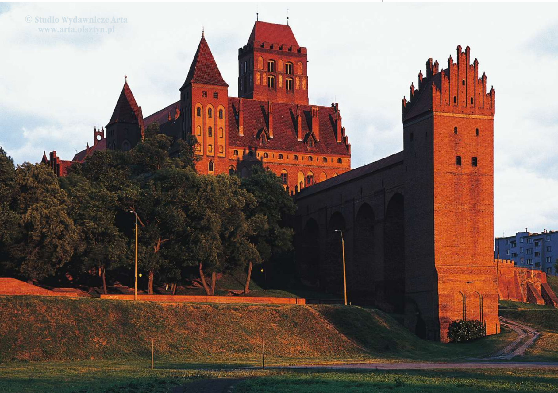
Widok na zamek kapituły od północy, na pierwszym planie wieża gdańska

Miasto związane z najwcześniejszym etapem ekspansji Zakonu na ziemię pruskie, malowniczo położone na wysokim, wschodnim brzegu pradoliny Wisły w zakolu rzeki Liwa, prawego dopływu Nogatu. Na północ od Kwidzyna, w odległości 22 km, znajduje się dawny zamek krzyżacki w Sztumie, a 14 km dalej była stolica Zakonu Krzyżackiego w Prusach – Malbork.