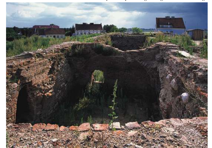
Widok od wschodu na najstarsze piwnice głównego domu zamkowego

Morąg / Mohrungen zamek krzyżacki prokuratorowski, wójtowski 267