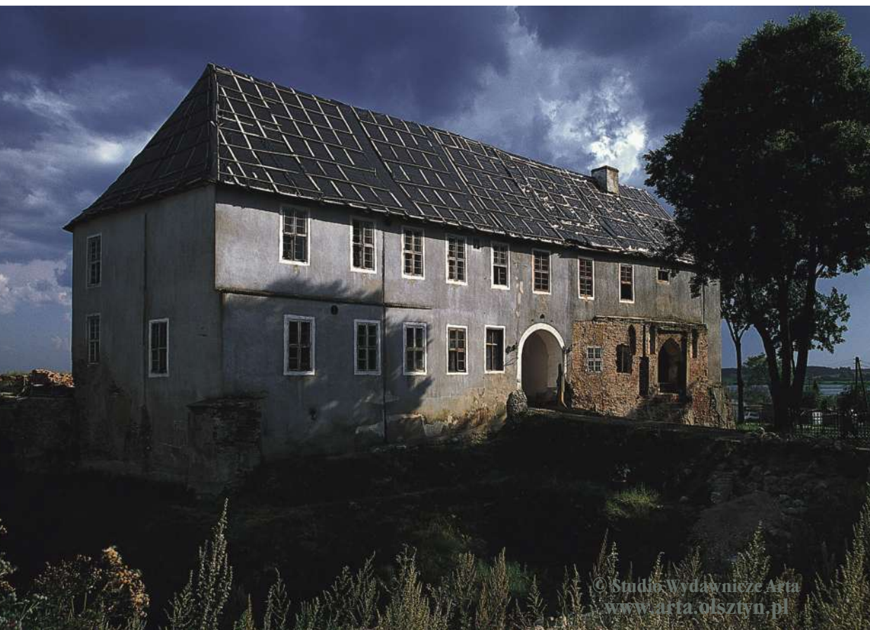
Skrzydło bramne z odsłoniętą bramą gotycką, widok od północnego wschodu, stan z 2003 r.

Zamek zaczęto budować około 1280 roku jako siedzibę prokuratora. Na podstawie badań wykopaliskowych przeprowadzonych w 2002 roku przez Jerzego Gulę można z pewnym prawdopodobieństwem wyodrębnić dwa główne etapy budowy zamku. Pierwszy, od około 1280 roku – wzniesienie zamku prokuratorowskiego i drugi, od około 1331 roku – rozbudowa zamku na siedzibę wójta krzyżackiego. Około 1380 roku warownia osiągnęła swój pełny, gotycki kształt.