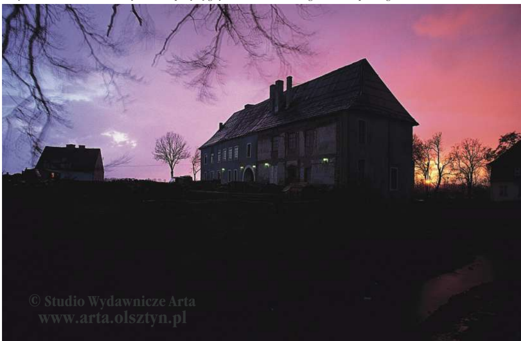
Skrzydło bramne, widok od strony kościoła, powyżej gotyckie kształtki z dawnego żebra sklepiennego