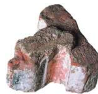
Gotycka kształtka z żebra sklepiennego

266 zamek krzyżacki prokuratorowski, wójtowski Morąg / Mohrungen