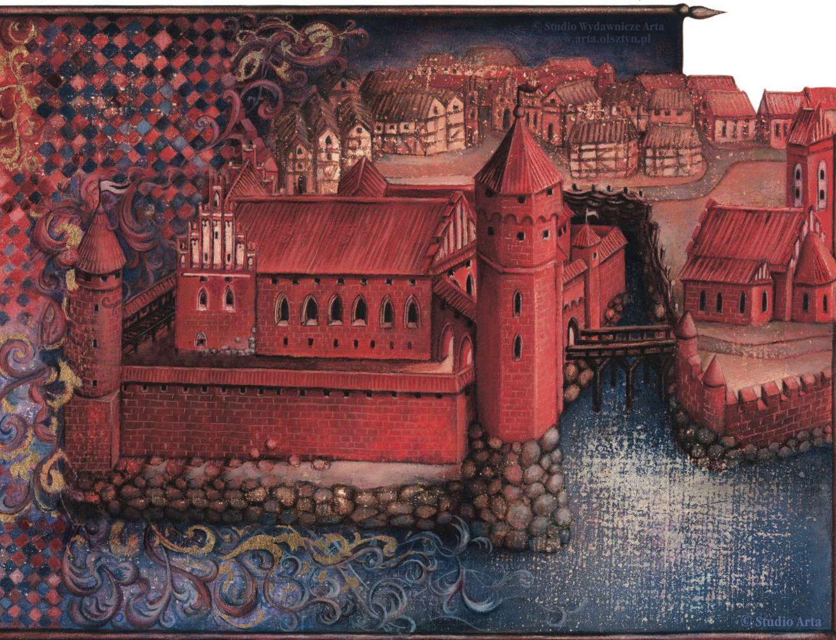
Rekonstrukcja zamku z czasów krzyżackich – widok od strony jeziora

umieszczonego nad fosą gdaniska, mniejszy występ odsłonięto parę metrów dalej – być może tu znajdowała się kładka do kościoła.