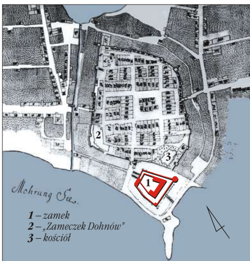
Plan sytuacyjny Morağa, wg mapy z poł. XVIII w.

Zamek i miasto Morağ powstały najprawdopodobniej na miejscu pruskiej osady Morina . Miejsce to, leżące na terenie Pogezanii, późniejszych Górnych Prus (Oberlandu), po podboju krzyżackim i podziale administracyjnym Prus znalazło się na terenie komturstwa elbląskiego. Władze Zakonu około 1280 roku ustanowiły tu prokuratorię, a w 1331 roku Morağ stał się siedzibą wyższego rangą wójtostwa. W 1327 roku prawa miejskie osadzie przy zamku nadał komtur elbląski i wielki szpitalnik Zakonu Herman von Oppen. Przywilej odnowiono w 1331 roku. Do dzisiaj z dawnego, dużego założenia zamkowego zachowało się jedynie mocno przebudowane w okresie renesansu skrzydło bramne, odsłonięte