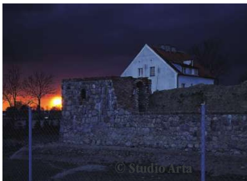
Rekonstruierter Unterbau des Südturmes