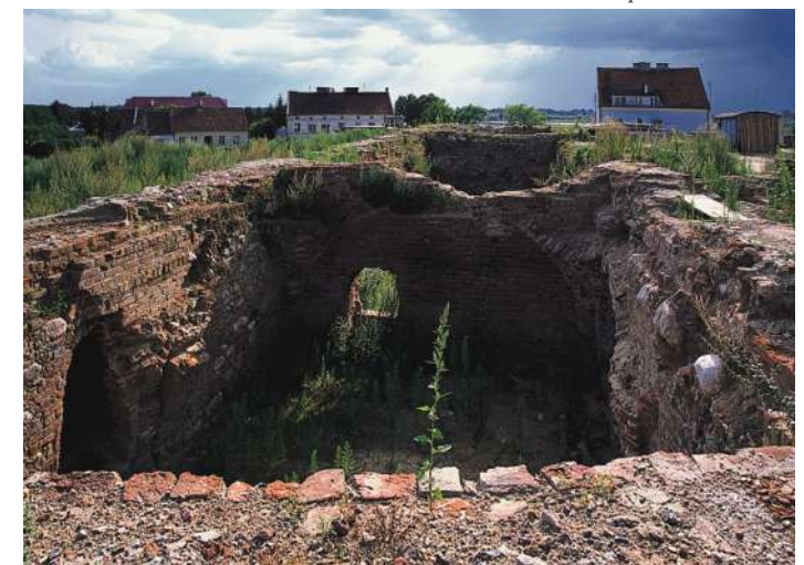
Älteste Kellerräume des Haupthauses von Osten

Morag / Mohrungen Pflegerburg, Vogtburg des Deutschen Ordens 267