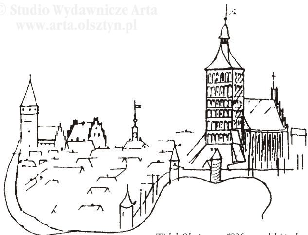
Widok Olsztyna w 1826 r., w głębi po lewej zamek, w środku ratusz, na pierwszym planie kościół św. Jakuba, rys. J. M. Giesege