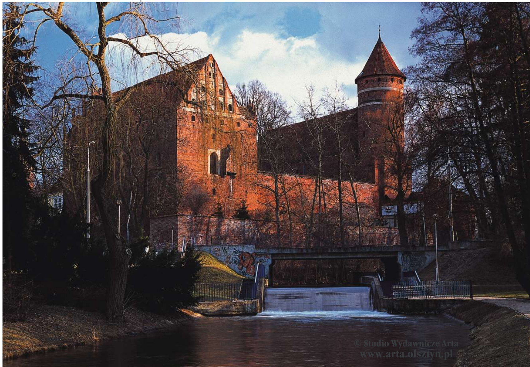
Widok na zamek od północy, od strony Łyny, po lewej dawny dom główny (skrzydło północno-wschodnie)

Założycielami zamku i miasta byli przedstawiciele kapituły warmińskiej. Po podziale ziem pruskich na diecezje w roku 1243, pierwszy biskup diecezji warmińskiej, Anzelm, otrzymał, zgodnie z postanowieniami traktatu, trzecią część terytorium diecezji, jako dominium biskupie (na którym biskup sprawował