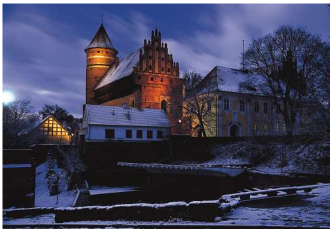
Widok na zamek od południa, od strony miasta

Zamek kapituły warmińskiej w Olsztynie jest jednym z piękniejszych zamków regionu. Dobrze zachowany w swym gotyckim kształcie ceglanej twierdzy, z wyniosłą wieżą obronną w narożu, interesującym późnobarokowym skrzydłem od strony miasta, urokliwym dziedzińcem ze studnią i posagiem „Baby Pruskiej” – zachwyca architekturą i klimatem, który tworzy. Dawne fosy, międzymurza i dalsze otoczenie porasta dziś parkowy starodrzew, a zamkowe wzniesienie od zawsze oblewa Łyna (w j. pruskim Alne ), dopełniając malowniczości obronnego założenia.