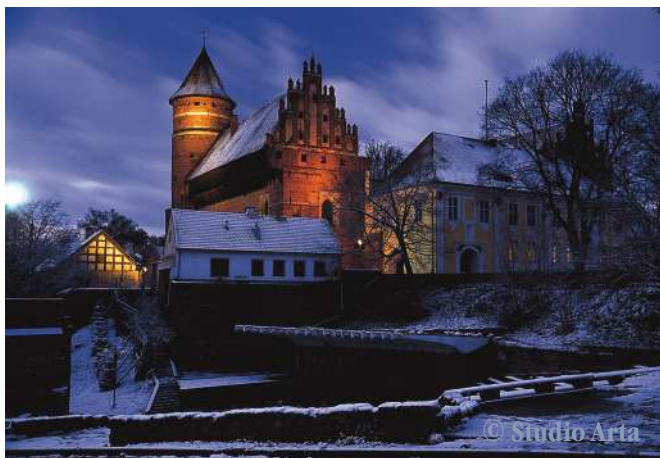
Burg von Süden, von der Stadtseite

Die Burg des ermländischen Domkapitels in Allenstein gehört zu den schönsten Burgen der Region. Die in ihrer gotischen Form gut erhaltene Backsteinfeste mit imposantem Wehrturm, dem interessanten spätbarocken Flügel, dem malerischen Hof mit Brunnen und der Figur einer „preußischen Babe“ begeistert durch ihre erlesene Architektur und einzigartige Atmosphäre. Eine Parkanlage bedeckt heute die einstigen Gräben und Zwinger, die Alle/Lyna (preußisch Alme ), die schon immer den Burghügel umfloss, verleiht der pittoresken Feste eine besondere Note.