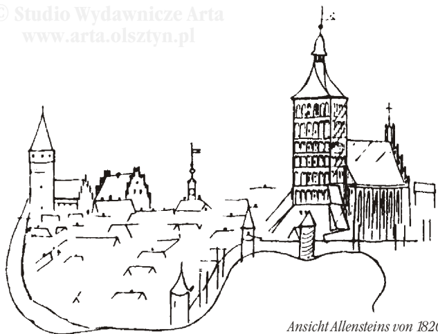
Ansicht Allensteins von 1826, links im Hintergrund die Burg, müßig das Rathaus, im Vordergrund die St. Jakobkirche; Zeichnung von J. M. Giese